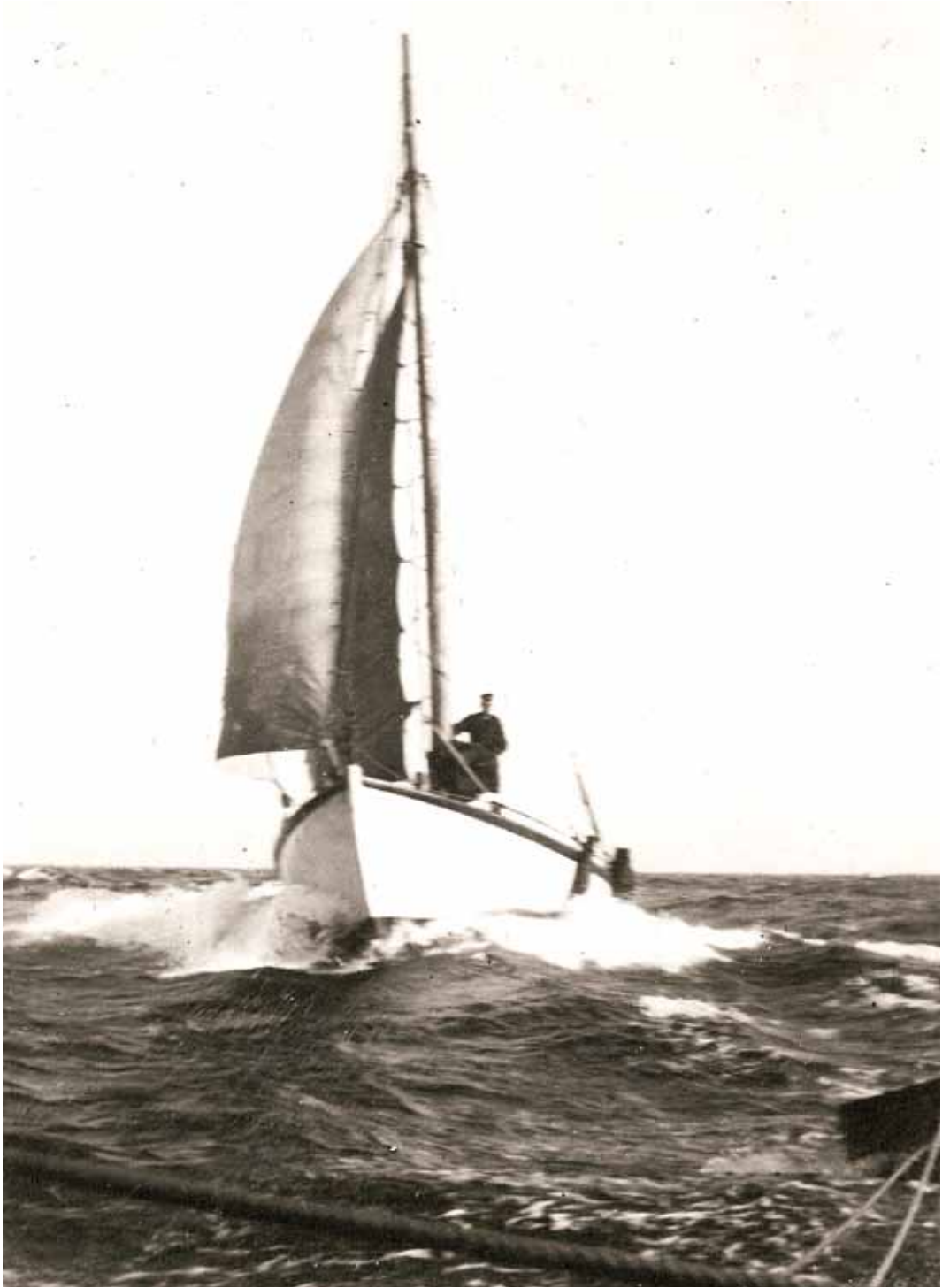
22 "Viking" i Skagerrak 10. juli 1906.