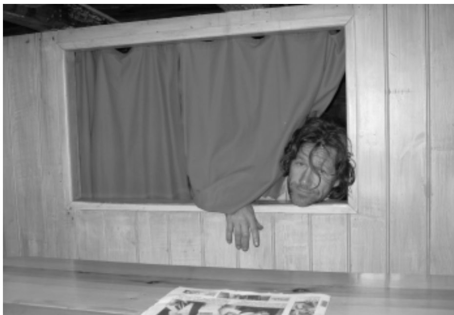
Nicolay i dukketeater, dvs. sjefssengen ombord.

Det høljregner nå. Vi må bite i det sure eplet og bryte. Ned med alle seilene. Game is over. Vi blir loset i land nå, den siste halvannen timen mot Skagen. Vi liker det ikke, men vi skjønner alvoret. Pumpen går og vannet strømmer ut av skuta. Vi skjønner omfanget og alvoret.