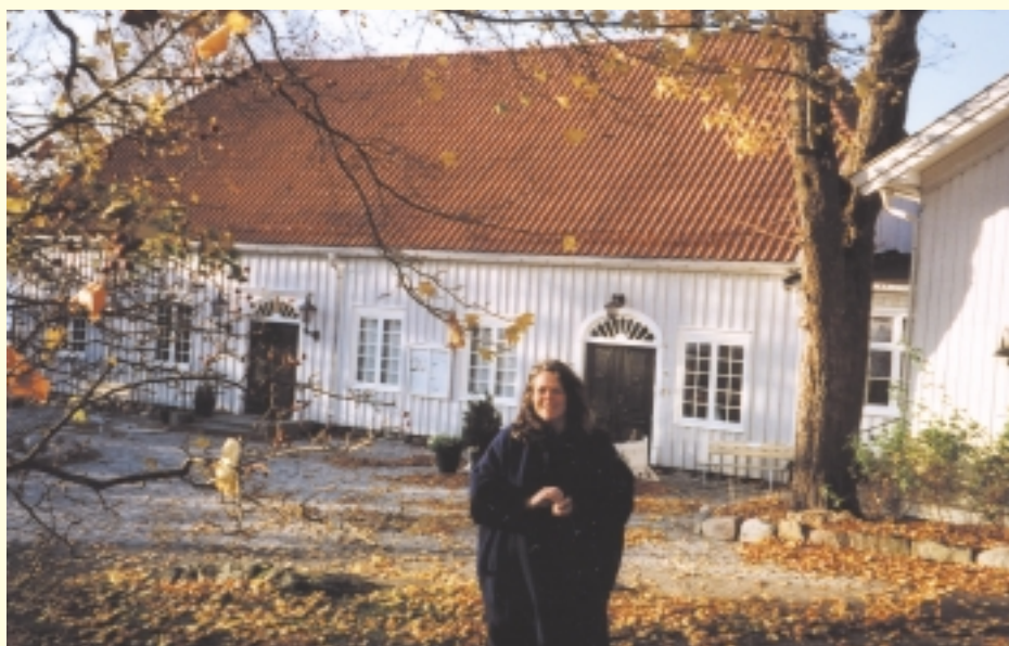
Archerhuset imot syd.

Hvordan få folk med på dugnad? Hildes resept er god organisering - rett person på rett plass og godt tilrettelagte oppgaver. Folk må klare oppgavene sine og føle at de gjør noe nyttig. Interesserte blir spurt om hvilke