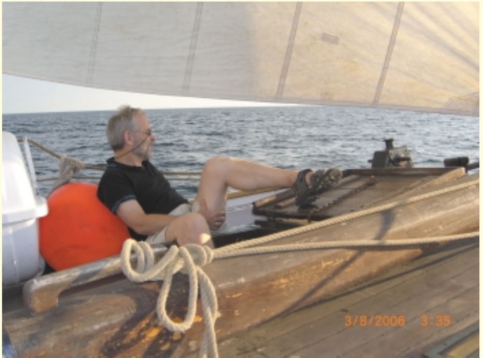
Forfatteren ombord i Frithjof i 2006.