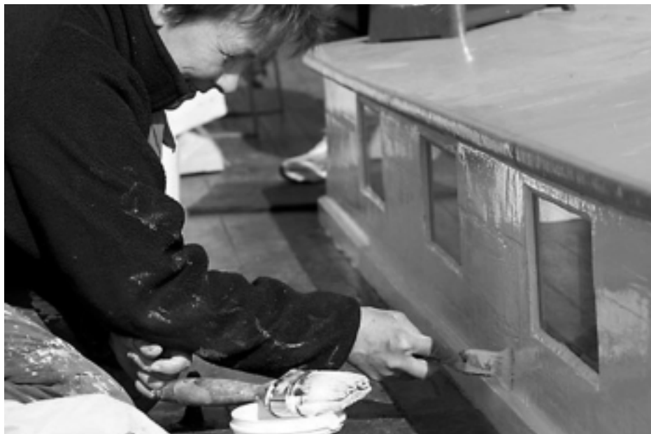
Ingun har malt med stø hånd i mange år.